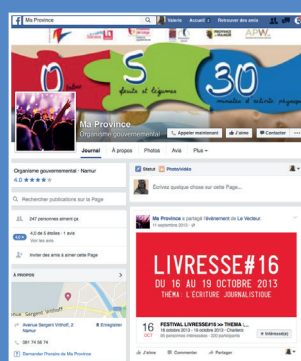
► « Ma Province »