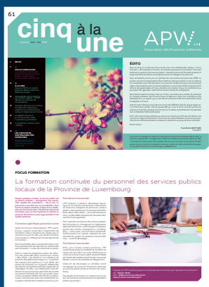
► « Cinq à la Une »

Un bimestriel envoyé à plus de 2500 lecteurs (inscription via notre site Internet) :